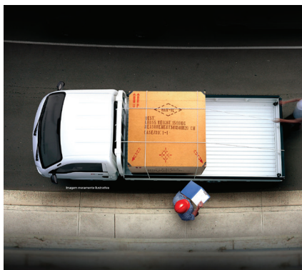
Liberado para circular em estradas e áreas urbanas