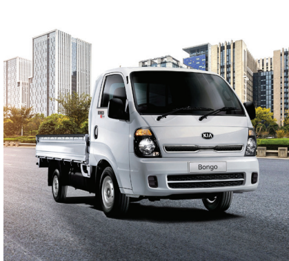
Liberado para circular em áreas restritas