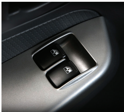
Vidros e travas elétricos, oferecendo conforto e comodidade