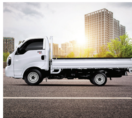
Pode ser conduzido com habilitação Tipo B

Imagens da versão K.798 - Ano/modelo 21/22