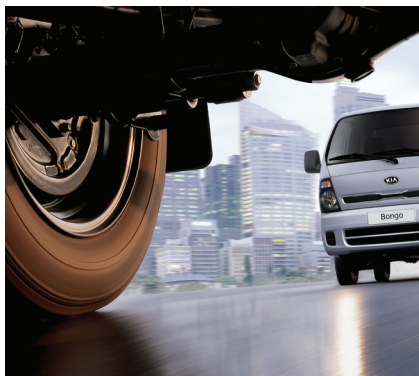
Tecnologia ABS (Anti-lock Brake System) impede o travamento das rodas e mantém o controle do motorista com o maior poder de frenagem. Já o EBD (Electronic Brake Force Distribution) garante maior eficiência ao sistema, permitindo melhor estabilidade e controle, mesmo em caso de frenagens feitas em curvas