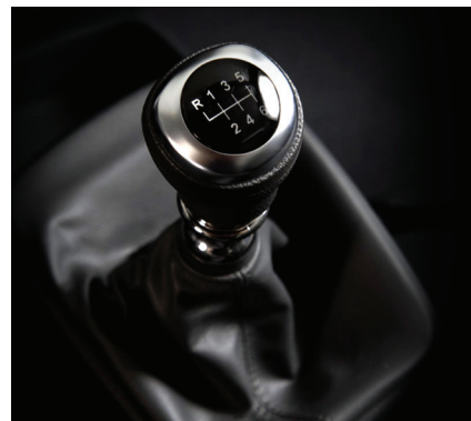
Transmissão manual de 6 velocidades com marchas mais suaves