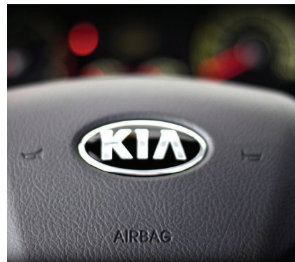
Air bag frontal duplo, barras de proteção contra impactos laterais e proteção estrutural da cabine em "T" contra impacto frontal