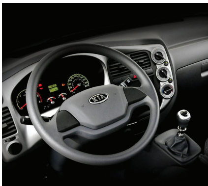
Ar-condicionado e direção hidráulica progressiva, tornando a condução mais segura e confortável

Conheça o Bongo. Criado para ser ágil como nossos centros urbanos precisam.